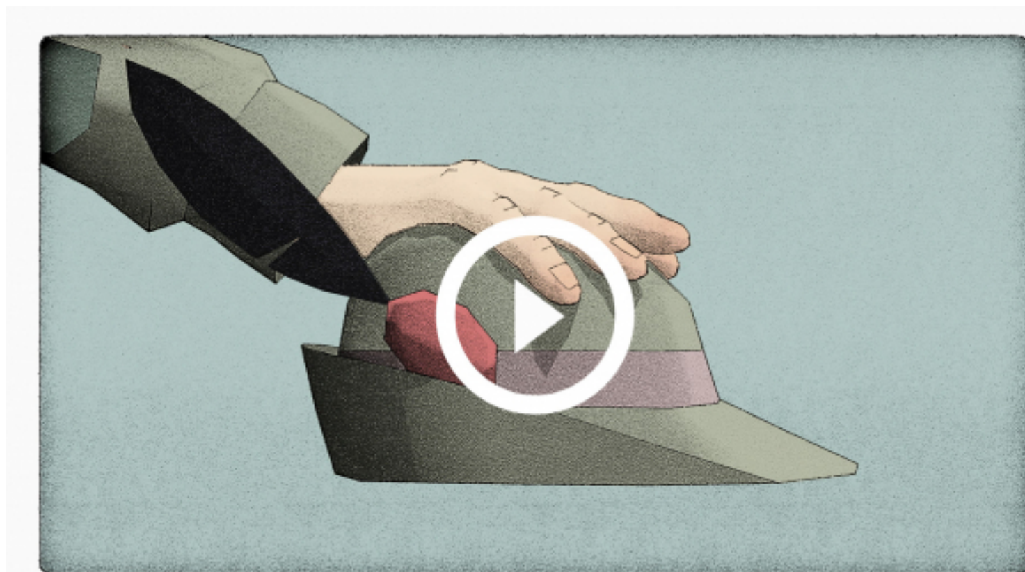
«59 secondes» de Mauro Carraro, (CH 2017) Prix du public Animatou

Ce que vous pouvez faire pour contrer l'initiative