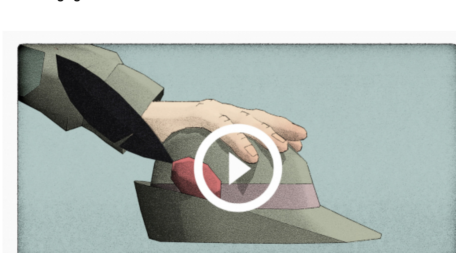
«59 secondes» von Mauro Carraro, (CH 2017), Publikumspreis Animatou