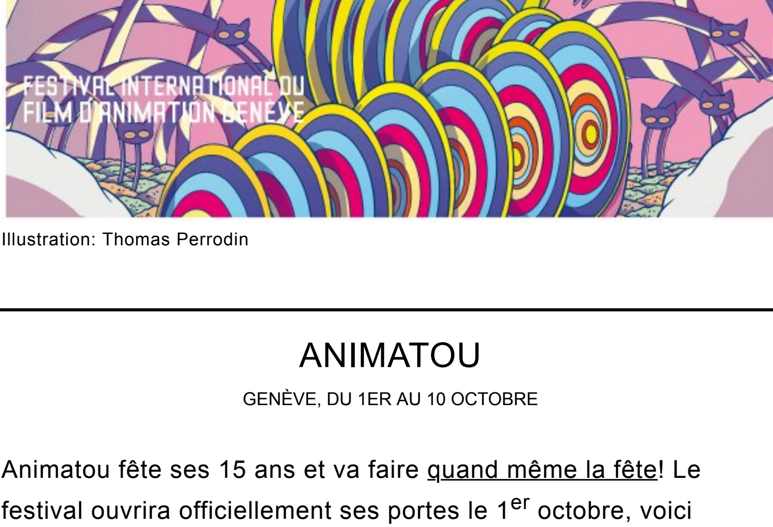
Illustration: Thomas Perrodin

P.-S.: N'oubliez pas d'inscrire vos films pour le Prix du cinéma suisse d'ici le 30 septembre.